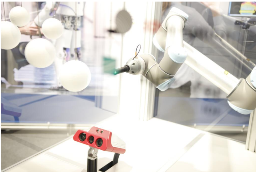
Abb. 3: Per Gestensteuerung können Besucher mit einem Roboterarm Styroporkugeln anstupsen.

Die Fraunhofer-Gesellschaft ist die führende Organisation für angewandte Forschung in Europa. Unter ihrem Dach arbeiten 67 Institute und Forschungseinrichtungen an Standorten in ganz Deutschland. 24 000 Mitarbeiterinnen und Mitarbeiter bearbeiten das jährliche Forschungsvolumen von mehr als 2,1 Milliarden Euro. Davon fallen über 1,8 Milliarden Euro auf den Leistungsbereich Vertragsforschung. Über 70 Prozent dieses Leistungsbereichs erwirtschaftet die Fraunhofer-Gesellschaft mit Aufträgen aus der Industrie und mit öffentlich finanzierten Forschungsprojekten. Die internationale Zusammenarbeit wird durch Niederlassungen in Europa, Nord- und Südamerika sowie Asien gefördert.